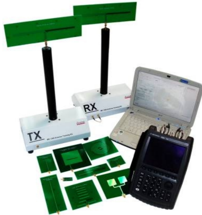
Dreamcatcher Antenna and Propagation ME1300